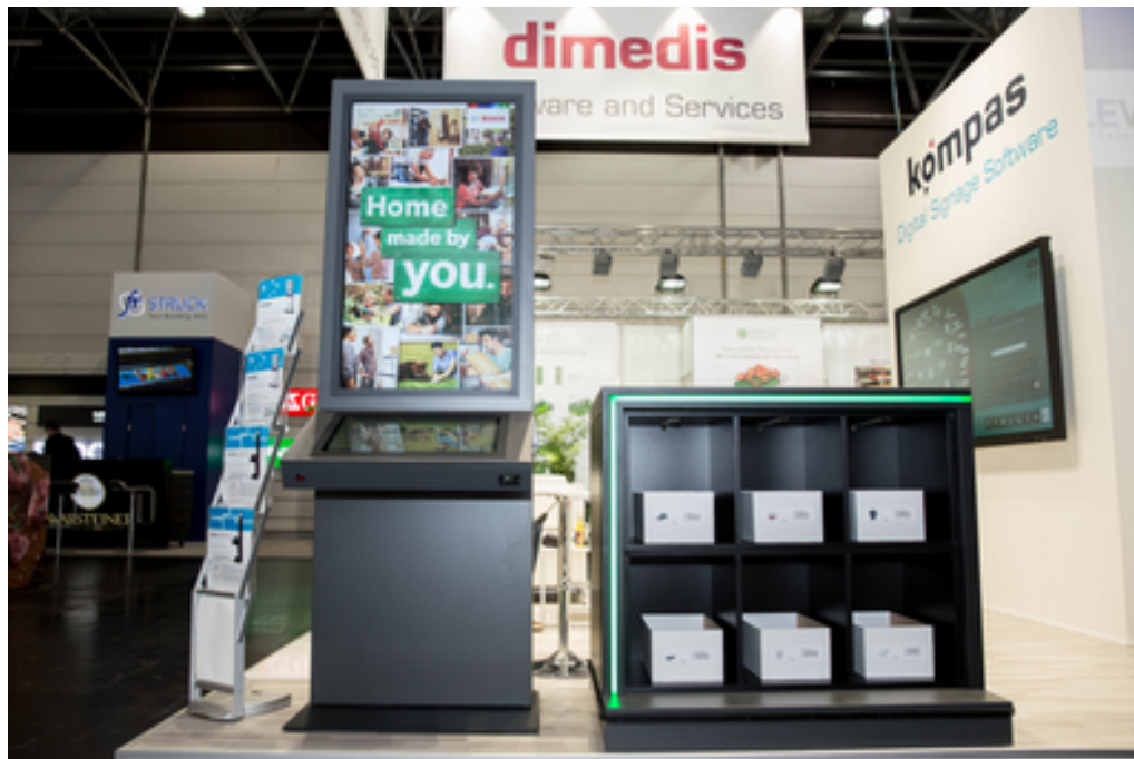
Nahtlose Integration von interaktivem Digital Signage mit einer modernen Produktpräsentation im Regal