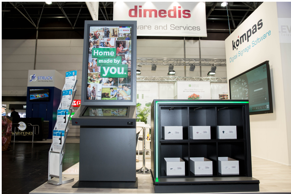
Nahtlose Integration von interaktivem Digital Signage mit einer modernen Produktpräsentation im Regal

dimedis präsentiert die nahtlose Integration von interaktivem Digital Signage mit einer modernen Produktpräsentation im Regal. Wählt der Nutzer ein Produkt auf der Stele aus, so leuchtet es im Regal nebenan auf. Der Nutzer kann nun das Produkt ausprobieren und gleich mitnehmen. EuroCIS-Besucher können diese Funktion am Beispiel der Bosch Experience Zone testen.