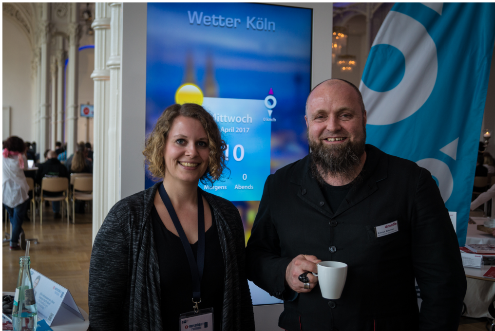
Erneut unterstützt dimedis den eMarketing Day und ist Aussteller vor Ort

Software anonymisiert alle Aktionen und Suchen der Anwender und ist so ein permanentes Umfragewerkzeug. Kernstück ist die intuitive LogoCloud, die in dieser Form z.B. als interaktives Wegeleitsystem in Einkaufszentren eingesetzt wird.