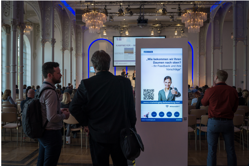
Die Digital Signage Softwarelösung kompas von dimedis im Einsatz: Interaktives Digital Signage am POS

unserem Stand und die Mietstelen auf dem Gelände können die Besucher praxisnah erleben, wie Digital Signage effektiv am POS eingesetzt werden kann."