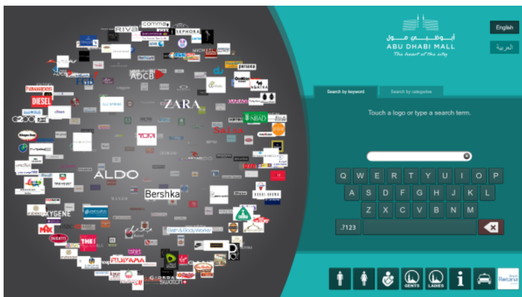
Digitale Wegeleitung der Abu Dhabi Mall live testen!

Besucher der Veranstaltung können auf dem gesamten Gelände einige kompas-Mietstelen nutzen. Die Mietstelen sind mit einem 55