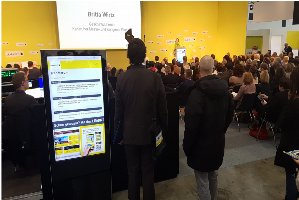
Digitale Stele auf der Learntec

eingebunden, ein FairMate -Modul. FairMate ist ein Gesamtlösung für das Besuchermanagement von Messen und wie kompas aus dem Hause dimedis.