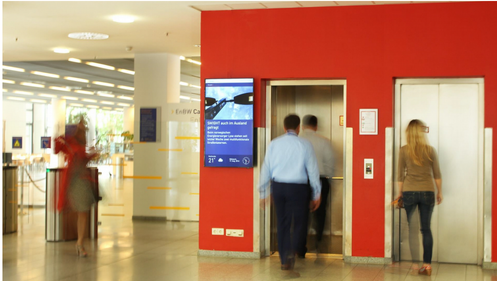
EnBW installiert Digital Signage für eine moderne Mitarbeiterkommunikation.